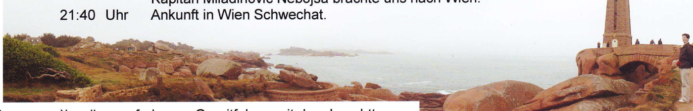
Ploumanac'h - die rosafarbenen Granitfelsen mit dem Leuchtturm.